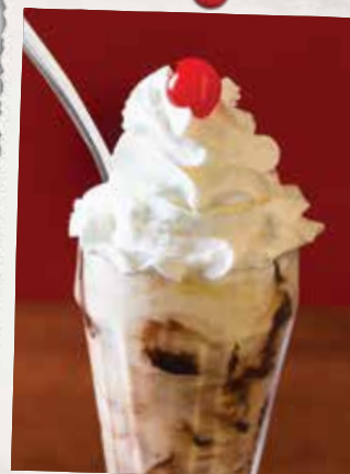
SUNDAE À L'ANCIENNE OLD FASHIONED ICE CREAM SUNDAE 8 95