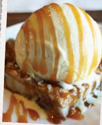
CROUSTADE AUX POMMES APPLE CRISP 11