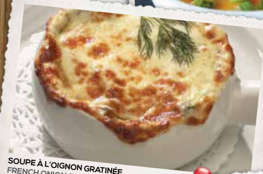
SOUPE À L'OIGNON GRATINÉE FRENCH ONION SOUP