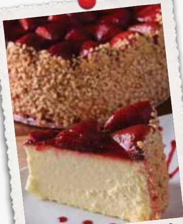
GÂTEAU AU FROMAGE AUX FRAISES STRAWBERRY CHEESECAKE 11 50