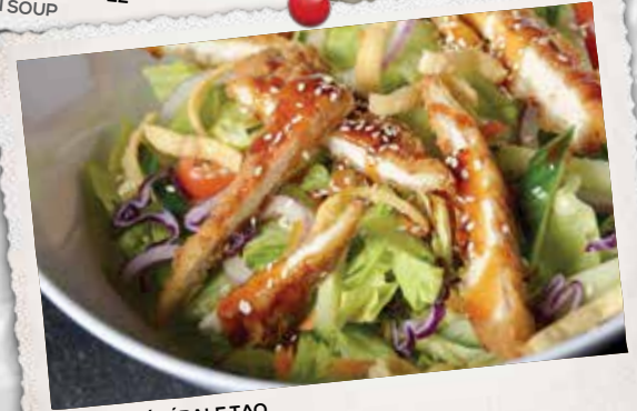
SALADE GÉNÉRALE TAO GENERAL TAO SALAD