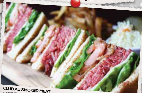
CLUB AU SMOKED MEAT SMOKED MEAT CLUB