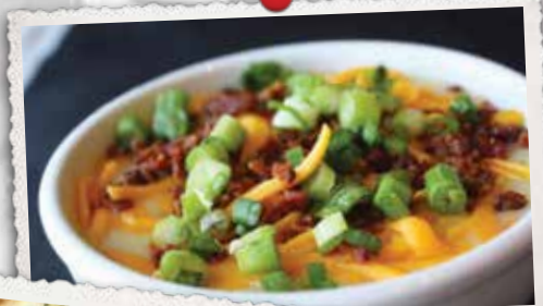
SOUPE LOUISIANE LOUISIANA SOUP

SOUPE À L'OIGNON SAVOUREUSE AVEC CROÛTONS, LE TOUT GARNI DE FROMAGE MOZZARELLA FONDU / OUR SAVORY ONION BROTH, WITH CROUTONS AND TOPPED WITH MELTED MOZZARELLA CHEESE