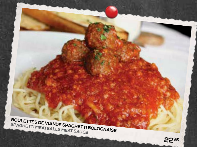
BOULETTES DE VIANDE SPAGHETTI BOLOGNAISE SPAGHETTI MEATBALLS MEAT SAUCE

CRÈME 35%, BEURRE, JAUNE D'OEUF, ÉCHALOTES, LE TOUT COUVERT DE SMOKED MEAT / 35% CREAM, BUTTER, EGG YOLK, TOPPED WITH SMOKED MEAT AND SHALLOTS