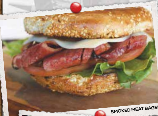
SMOKED MEAT BAGEL

NOTRE CÉLÈBRE SMOKED MEAT, FROMAGE SUISSE, BACON, LAITUE ET TOMATES. OUR FAMOUS SMOKED MEAT, SWISS CHEESE, CRISP BACON, LETTUCE AND TOMATO.