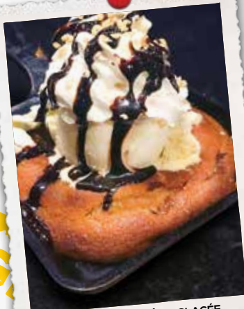
BISCUIT CHAUD ET CRÈME GLACÉE HOT COOKIE AND ICE CREAM 11