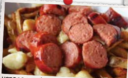
HOT DOG GRILLÉ TOUT BOEUF GRILLED ALL BEEF HOT DOG