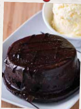
VOLCAN AU CHOCOLAT CHOCOLATE VOLCANO 11