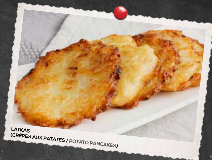
LATKAS (CRÊPES AUX PATATES / POTATO PANCAKES)

2 PELURES DE POMMES DE TERRE, 6 EGG ROLLS AU SMOKED MEAT, 6 BÂTONNETS DE FROMAGE ET RONDELLES D'OIGNON / 2 POTATO SKINS, 6 SMOKED MEAT EGG ROLLS, 6 CHEESE STICKS AND ONION RINGS