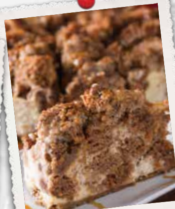
GÂTEAU AU FROMAGE AUX CAROTTES ET CARAMEL CARROT CARAMEL CHEESECAKE 11