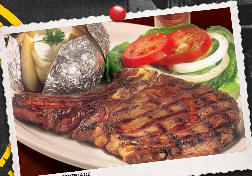
STEAK D'ENTRECÔTE 14 OZ 14 OZ AAA RIB STEAK