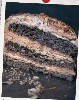
CHOCOLAT CHOCOLAT CHOCOLAT CHOCOLATE CHOCOLATE CHOCOLATE CAKE 11