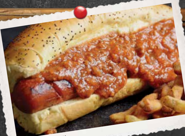
HOT DOG MICHIGAN

POITRINE DE POULET PANÉE, BACON, LAITUE, TOMATE ET NOTRE MAYONNAISE MAISON ÉPICÉE BREADED CHICKEN BREAST, BACON, LETTUCE, TOMATO AND OUR HOUSE SPICY MAYO