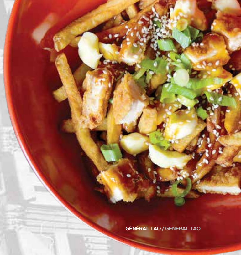
GÉNÉRAL TAO / GENERAL TAO